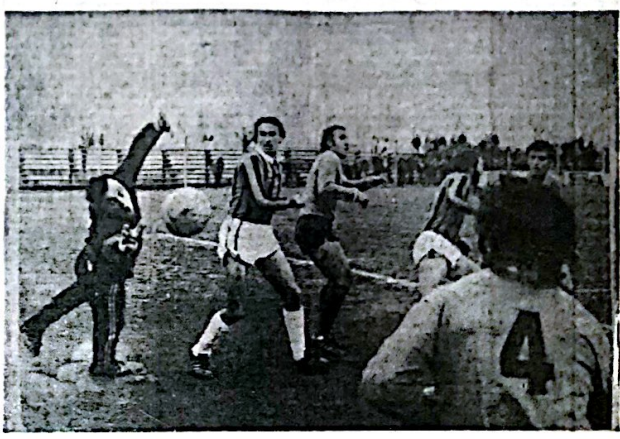
Estudiantes y San Martín, también en un momento de la tarde por la tarde en el estadio de la cancha de Calera Avellaneda, que se jugará el día 13. Quedó fuera de la competencia por la mala suerte de la tarde. En el Parque Guerrero también hubo tranquilidad entre los jugadores.

BUENOS AIRES 11 (NA). — El presidente de la Nación, general Jorge Rafael Videla, emprendió mañana su primera gira al interior del país en su carácter de jefe del Estado para visitar las provincias de Chubut y Santa Cruz y el sector nacional de Tierra del Fuego e Islas del Atlántico Sur.