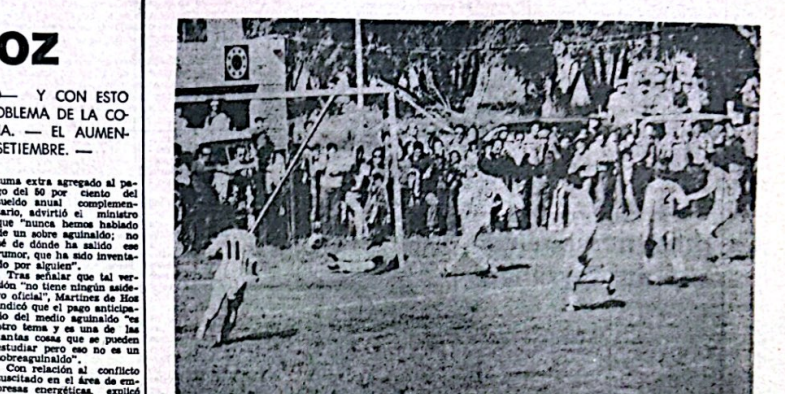
En la primera fecha del campeonato "Mayor" de 1976, Sierra Chica resultó el único ganador al vencer a Racing por 2 a 1. En el otro campo, disputado en la Villa Alfredo Portales, Loma Negra y Atlético Hinojo igualaron en un tanto.

BUENOS AIRES, 17 (NA). — El ministro de Economía, José Alfredo Martínez de Hoz, hizo un positivo balance de su gestión por el Extremo Oriente, tiempo que descalificó la versión sobre el pago de un suma extra con el medio aguinaldo "cuyo adelanto es una de las últimas cosas que se pueden exigir", al formular declaraciones poco después de arribar hoy al aeropuerto Internacional de Ezeiza.