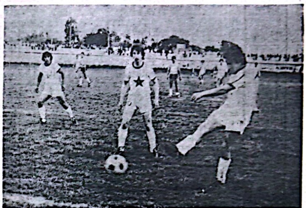
Por la segunda fecha del torneo "Mayor" de fútbol, realizada ayer, Racing en el Parque Olavarría se impuso por dos goles contra uno a Loma Negra, mientras que en Hinojo el local y Sierra Chica igualaron en un gol. Este a su vez empató Sierra Chica con Loma Negra...

Sierra Chica sigue siendo el único líder