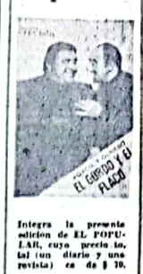
Esta revista es para Ud.