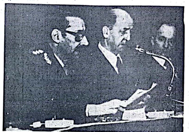
BUENOS AIRES 6 (N.A.). — El presidente Videla habla, esta tarde, durante el acto de clausura del congreso internacional de la Asociación Cristiana de Jóvenes, en esta capital.