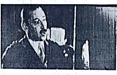
El presidente de la Nación, leonido general Jorge Illia, durante la inauguración de la novena reunión nacional de las Confederaciones Rurales Argentinas (CRA) en San Luis.

SAN LUIS 4 (NA) — Al inaugurar esta tarde aquí la novena reunión nacional de las Confederaciones Rurales Argentinas (CRA), el presidente de la Nación, leonido general Jorge Illia, declaró que el objetivo de la política agraria es lograr una agricultura moderna y eficiente, capaz de producir alimentos para el consumo interno y materias primas para la industria. Illia afirmó que la política agraria debe ser una política nacional, que permita el desarrollo de la agricultura y la industria, y que permita la integración de la economía argentina.