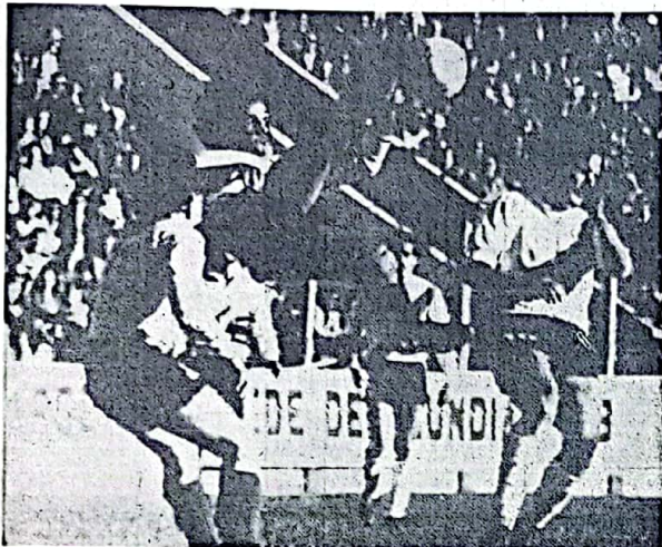
Buenos Aires, 17 (NA). — En la reanudación del torneo Metropolitano de fútbol, los punteros, River Plate (lider) y Vélez Sarsfield ganaron en sus respectivos compromisos. Por su parte también ganaron Independiente,

Racing y Boca Juniors, tras una semana de vacaciones. La nota gráfica corresponde al colista que River le ganó a Atlanta por 2 a 1 en la cancha de River.