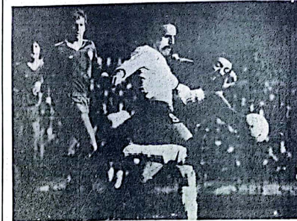
BUENOS AIRES, 24 (NA). - Independiente le ganó al puntero River Fútbol en la jornada de ayer por el Campeonato Metropolitano de Fútbol. Los "millonarios" conservan dos unidades de ventaja sobre Vélez, que igualó sus goles con Lanús. Racing ganó en el otro clásico, ante Huracán, como visitante, por dos a cero y Boca Juniors en su cancha se impuso a Chacarita Juniors. En la nota gráfica una escena del partido Independiente - River. Luego de los "millonarios" en una intensa acción con el arquero rojo Gay, Traverso, muy cerca, observa atentamente, (Radiofoto de Noticias Argentinas). AMPLIA INFORMACION DEPORTIVA Y MAS NOTAS GRAFICAS EN LAS PAGINAS 7 Y 8.