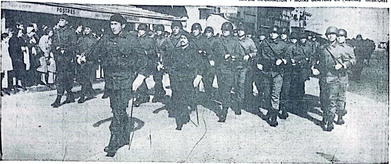
Desfile multitudinario, culminó en el paso marcial de los soldados de la guarnición, tanques, armamento ligero, elemento de comunicación,

AMPLIA INFORMACION Y NOTAS GRAFICAS EN PAGINAS INTERIORES