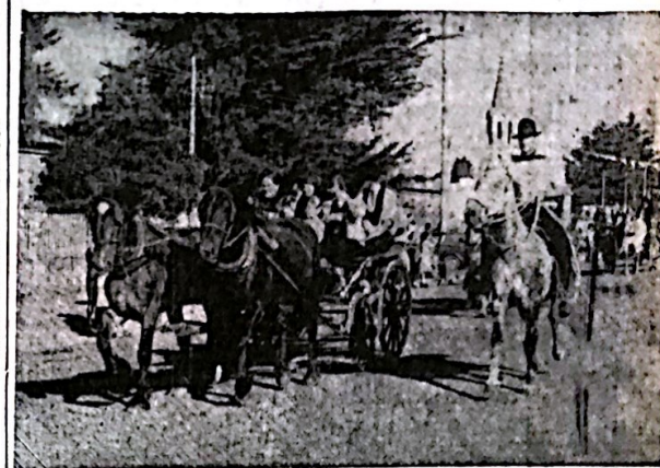
Un acontecimiento multitudinario significó el casamiento de dos jóvenes al estilo de principios de siglo. Una caravana que aquí se ve al momento del desfile por la arteria principal de la ciudad, mostró